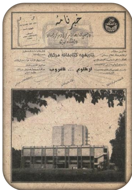
تصویر ۵۲. خبرنامه کتابخانه مرکزی و مرکز اسناد

این نشریه ضمن اعلام اخبار داخلی و تازه‌های کتابخانه (کتاب، نشریه و پایان‌نامه) به معرفی بخش‌های مختلف کتابخانه مرکزی، کتابخانه‌های دانشکده‌ها و واحدهای تابعه دانشگاه و پاره‌ای مطالب مربوط به حوزه کتابداری و اطلاع‌رسانی می‌پرداخت.